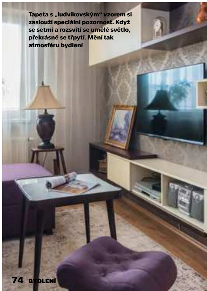
Tapeta s „ludvíkovským“ vzorem si zaslouží speciální pozornost. Když se setmí a rozsvítí se umělé světlo, překrásně se třpytí. Mění tak atmosféru bydlení