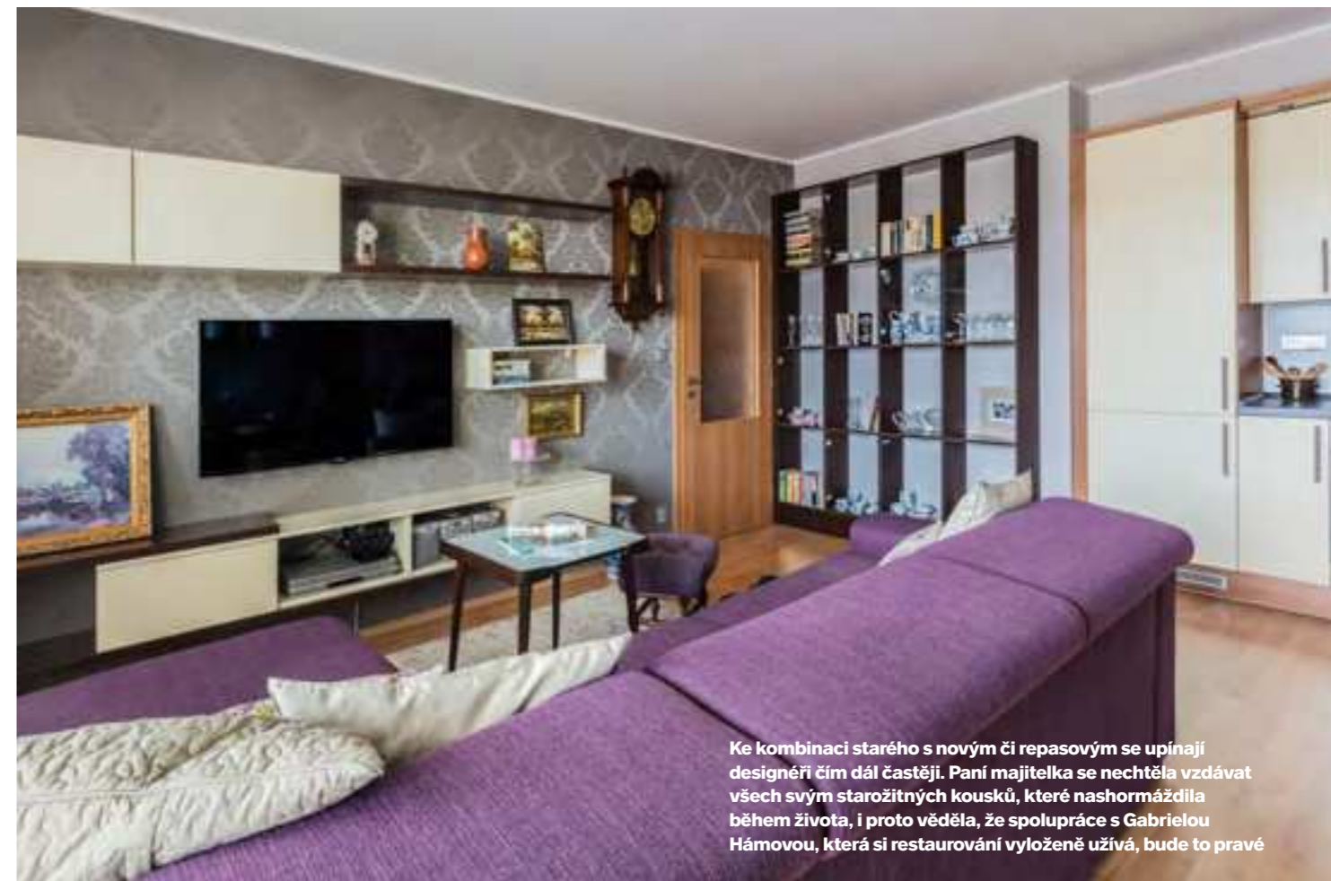
Ke kombinaci starého s novým či repasovým se upínají designéři čím dál častěji. Paní majitelka se nechtěla vzdávat všech svým starožitným kousků, které nashormáždila během života, i proto věděla, že spolupráce s Gabrielou Hámovou, která si restaurování vyloženě užívá, bude to pravé