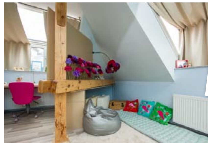
SNOVÁ zahrádka je vytvořena z umělých květin a lampy, kterou Gábina dotvořila.