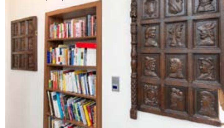
VEDLE niky, která vznikla zarděním dveří, visí dva vyřezávané neo-renesanční panely.