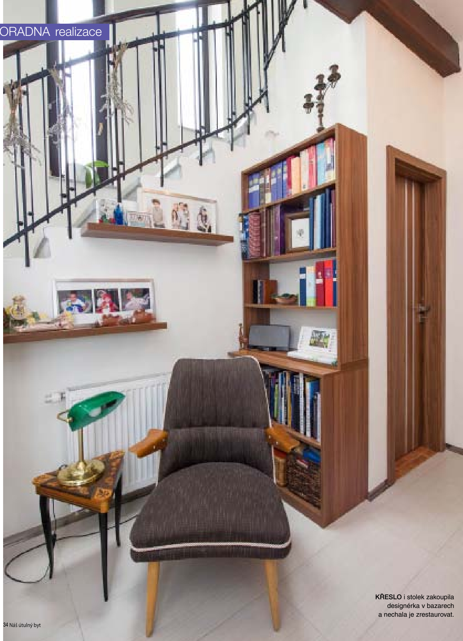
KŘESLO i stolec zakoupila designérka v bazarech a nechala je zrestaurovat.