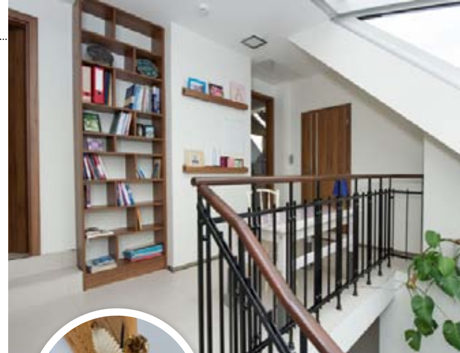
NA ULOŽENÍ knih je využit každý prostor. Chodba díky nábytku nepůsobí stroze, ba naopak – přibližuje se obývacímu pokoji.