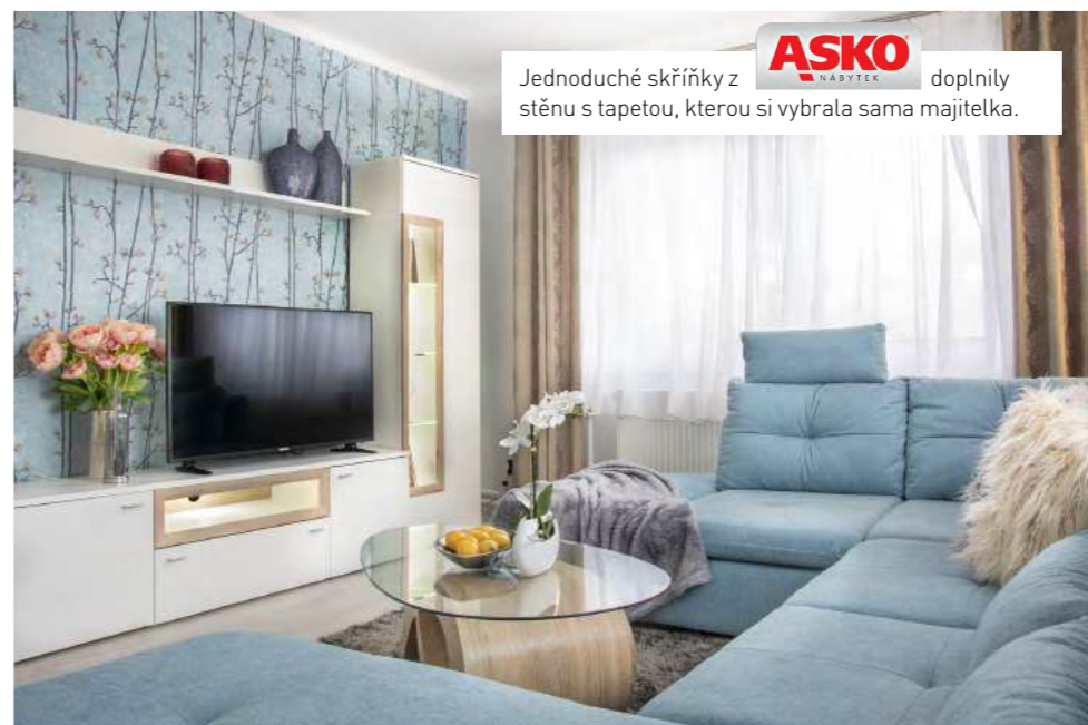
Jednoduché skříňky z ASKO NÁBYTEK doplnily stěnu s tapetou, kterou si vybrala sama majitelka.