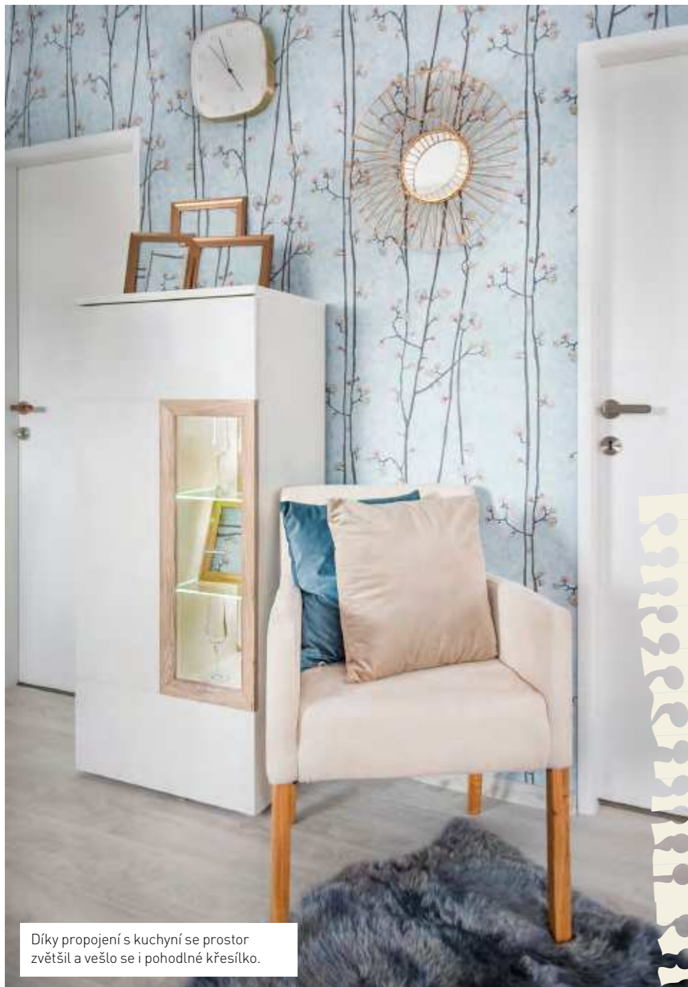
Díky propojení s kuchyní se prostor zvětšil a vešlo se i pohodlné křesílko.

a aby bylo dobře vidět na televizi. Dominantou celého prostoru se proto stala sedačka. Tato rodina hodně drží pospolu, scházejí se, takže bylo třeba pojmut prostor tak, aby se všichni pohodlně vešli. A aby zároveň mohl tatínek využívat sedačku k ležení. Ostatní nábytek jsem volila spíš decentní, čímž se propojil obývací s novou kuchyní," ukazuje nám designérka.