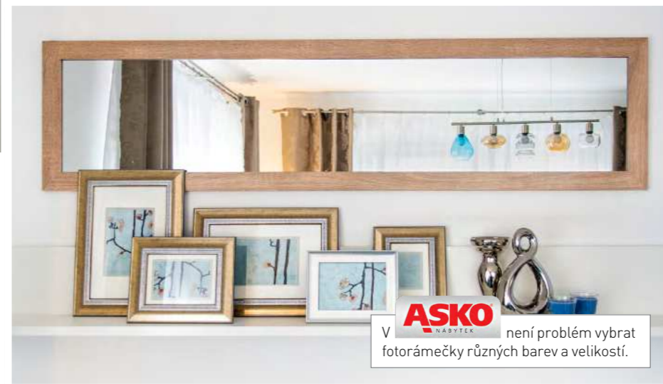
V ASKO NÁBYTEK není problém vybrat fotorámečky různých barev a velikostí.

PŘIPRAVILA: RUM