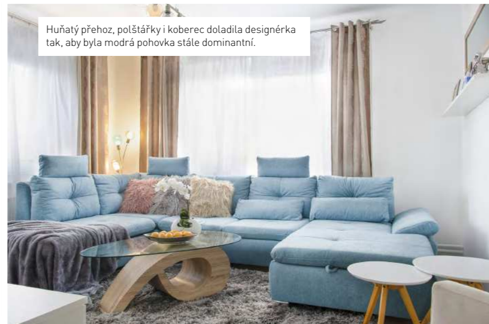
Huňatý přehoz, polštářky i koberec doladila designérka tak, aby byla modrá pohovka stále dominantní.