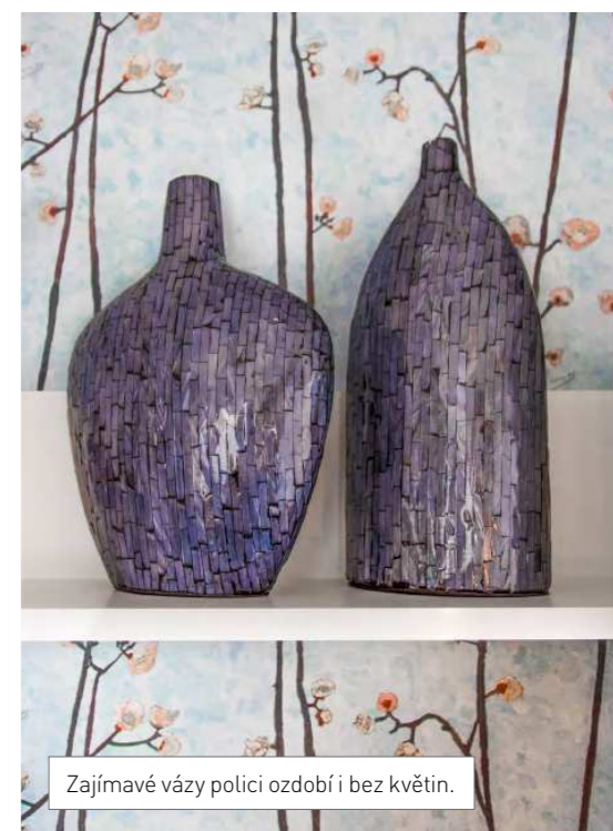
Zajímavé vázy polici ozdobí bez květin.