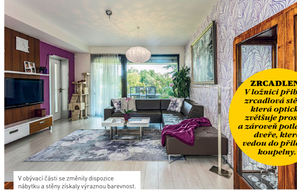
V obývací části se změnila dispozice nábytku a stěny získaly výraznou barevnost.

ZRCADLENÍ V ložnici přibyla zrcadlová stěna, která opticky zvětšuje prostor a zároveň potlačuje dveře, které vedou do přilehlé koupelny.