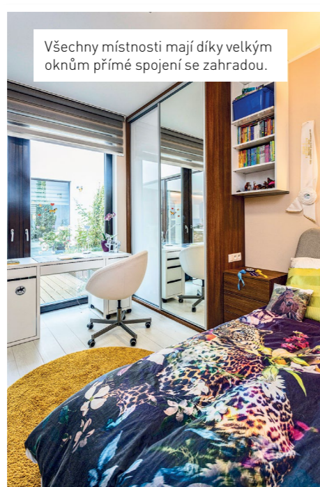
Všechny místnosti mají díky velkým oknům přímé spojení se zahradou.