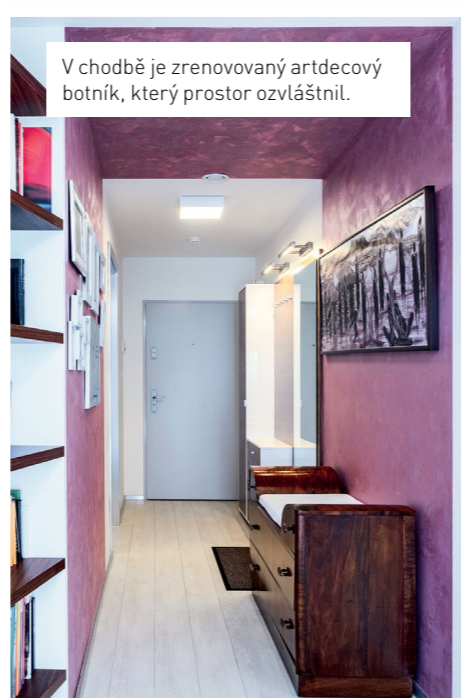
V chodbě je zrenovovaný artdecový botník, který prostor ozvláštnil.